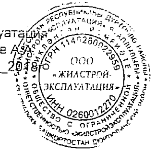
График весеннего осмотра кровли, вентканалов, фасада, продухов в цоколях зданий, подъездов, подвалов, чердаков, отмосток, системы водоснабжения, отопления и канализации жилых домов находящихся в управлении ООО "Жилстройэксплуатация" на апрель 2018г.