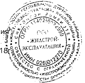
График осмотра системы электроснабжения жилых домов находящихся в управлении ООО "Жилстройэксплуатация" на апрель 2018г.