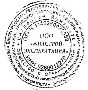
График осмотра системы электроснабжения жилых домов находящихся в управлении ООО "Жилстройэксплуатация" на октябрь 2018г.